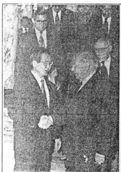
Saludo cordial entre el presidente Fujimori y el canciller del Uruguay, Héctor Gross Espiel, luego de la entrevista en Palacio de Gobierno.

duciéndola a un diálogo tradicional entre gobierno y cúpulas partidarias. En este diálogo se debe asegurar que las enmiendas que el pueblo espera sean debidamente consideradas. Yo espero que el realismo prevalezca entre los representantes del Gobierno y una Comisión Coordinadora Nacional constituida por representantes de todas las fuerzas vivas de la Nación.