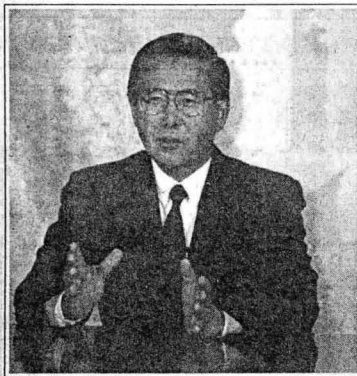
El presidente Alberto Fujimori dijo que, como gobernante, considerara ineludible consultar al pueblo, que es el soberano, sobre aspectos puntuales de qué reformas desean, de qué magnitud deben ser y qué es prioritariamente lo que debe cambiarse.

—Ya conseguimos, de eso no quepa la menor duda. Ahora en el exterior se sabe lo que buscamos. Por eso las sanciones no se produjeron. La oposición al 5 de abril con-