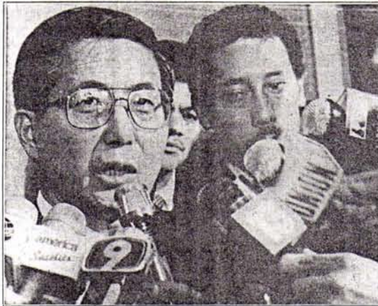
El presidente Alberto Fujimori sostiene que el pueblo apoya mayoritariamente las medidas adoptadas por su gobierno y que dentro de seis meses habrá un plebiscito para aprobar las reformas a la Constitución.

«La gente que cree que eso es factible está todavía en la luna», dijo al referirse