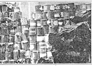
El facsímil muestra la resolución emitida por el presidente del JDE, Jorge Fernández Pérez, sobre la denuncia hecha por peroneros de diferentes agrupaciones en torno a la existencia de 500 ánforas sin el precinto de seguridad.