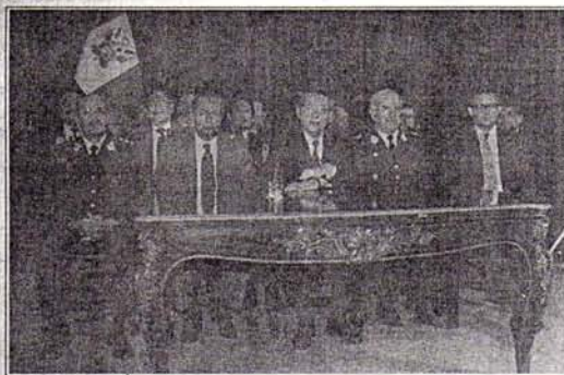
El Presidente Alberto Fujimori, rodeado de su gabinete ministerial, anuncia al país el cronograma del gobierno para el retorno a la democracia.

El sentir del pueblo, que ha podido ser expresado de manera tan tajante e indis-