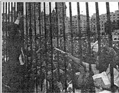
Horas antes de dirigir su mensaje al país, el presidente Fujimori recibió la adhesión de la gente que llegó hasta las rejas de Palacio de Gobierno.

A esto se suma la vacancia del Ministerio de Educación, cuyo titular hasta el momento no ha sido nombrado desde que fuera reemplazado el nuevo gabinete tras la renuncia del ex pre-