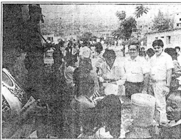
Los peruanos asistirán a las urnas en noviembre del 92, octubre del 94 y abril de 1995 de acuerdo al cronograma de retorno a la democracia que el presidente Fujimori.

Una de las primeras medidas que adoptará el «Gobierno de Emergencia y Reconstrucción Nacional» para este año será la democratización de las decisiones del Poder Ejecutivo, prepublicando las leyes de mayor importancia, para debate popular, mediante los medios de comunicación