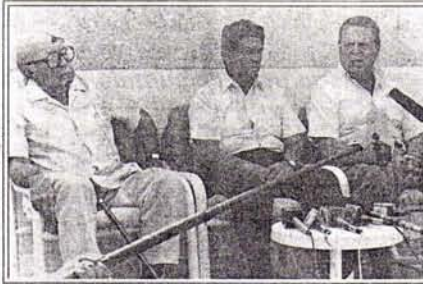
Los presidentes del Senado, Felipe Osterling y de Diputados, Roberto Ramírez del Villar, a los costados del segundo vicepresidente de la República, Carlos García y García, durante la conferencia de prensa que ofrecieron ayer.

extranjera. Y Osterling respondió que de una persona que ha roto el juramento hecho ante Dios y ante la Patria de respetar la Constitución se puede esperar cualquier cosa, menos que cumpla su palabra.