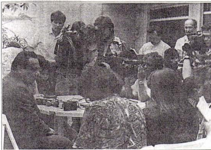
El presidente Máximo San Román señala que el cronograma de Fujimori sólo trata de legitimar su mandato y que es el mismo mecanismo que siempre han usado las dictaduras.

En su primer día luego de haber jurado el cargo de