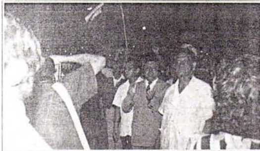
Algunos viajeros corrieron el nombre de Fujimori cuando San Román recorría los pasillos del aeropuerto internacional

Finalmente pronunció un breve mensaje en quechua, el mismo que tradujo y que, en síntesis, es un llamado al pueblo peruano "no dejarse llevar por las mentiras" y pide confiar en él por tratarse de un peruano "de corazón".