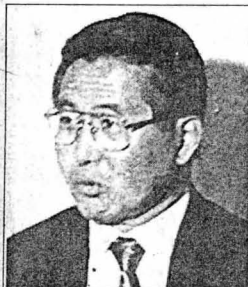
La denuncia del presidente constitucional, Máximo San Román, contra el presidente de hecho, Alberto Fujimori, ha sido acogida por la Corte Interamericana en momentos en que el país toma conocimiento de más consecuencias negativas de la ruptura del orden constitucional.

los Derechos Humanos convocó a sesión extraordinaria para conocer el texto de la acusación y fijó un plazo de diez días para citar a audiencia pública el próximo lunes 18 de mayo. En caso de concederse la medida tutelar, la Corte puede ordenar el cese inmediato de todos los actos ordenados por el gobierno de facto de Alberto Fujimori. Trascendió que hoy viernes, la Corte de Costa Rica enviará un fax al despacho de Fujimori notificando la denuncia y citando a su representante legal para que asuma la defensa del gobierno de facto.