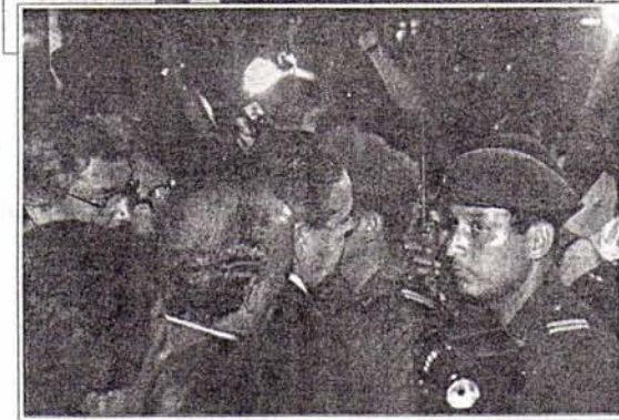
El arribo de San Román estuvo salpicado de fugaces incidentes cuando algunos viajeros corearon el nombre de Fujimori mientras el senador era llevado en hombros de algunos parlamentarios por los pasillos del aeropuerto internacional Jorge Chávez.

bien llegaron hasta nuestro primer aeropuerto.