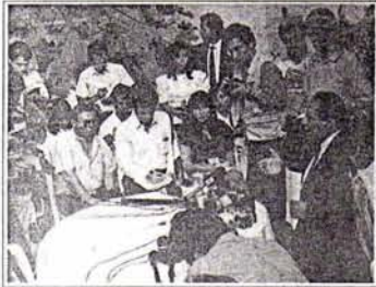
San Román expuso su propuesta ante la prensa nacional e internacional, a las que convocó especialmente a su domicilio. Dijo que su planteamiento iba dirigido a la sociedad civil organizada, con el fin de que ésta lo debata y lo enjuicie.

nion pública nacional y de la comunidad internacional».