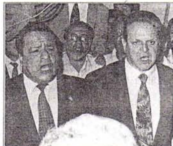
El senador San Román llegó anoche procedente de Estados Unidos y en el aeropuerto fue recibido por diputados y senadores, quienes lo reconocieron como el nuevo presidente del Perú.

Incluso se remontó hasta los primeros días de