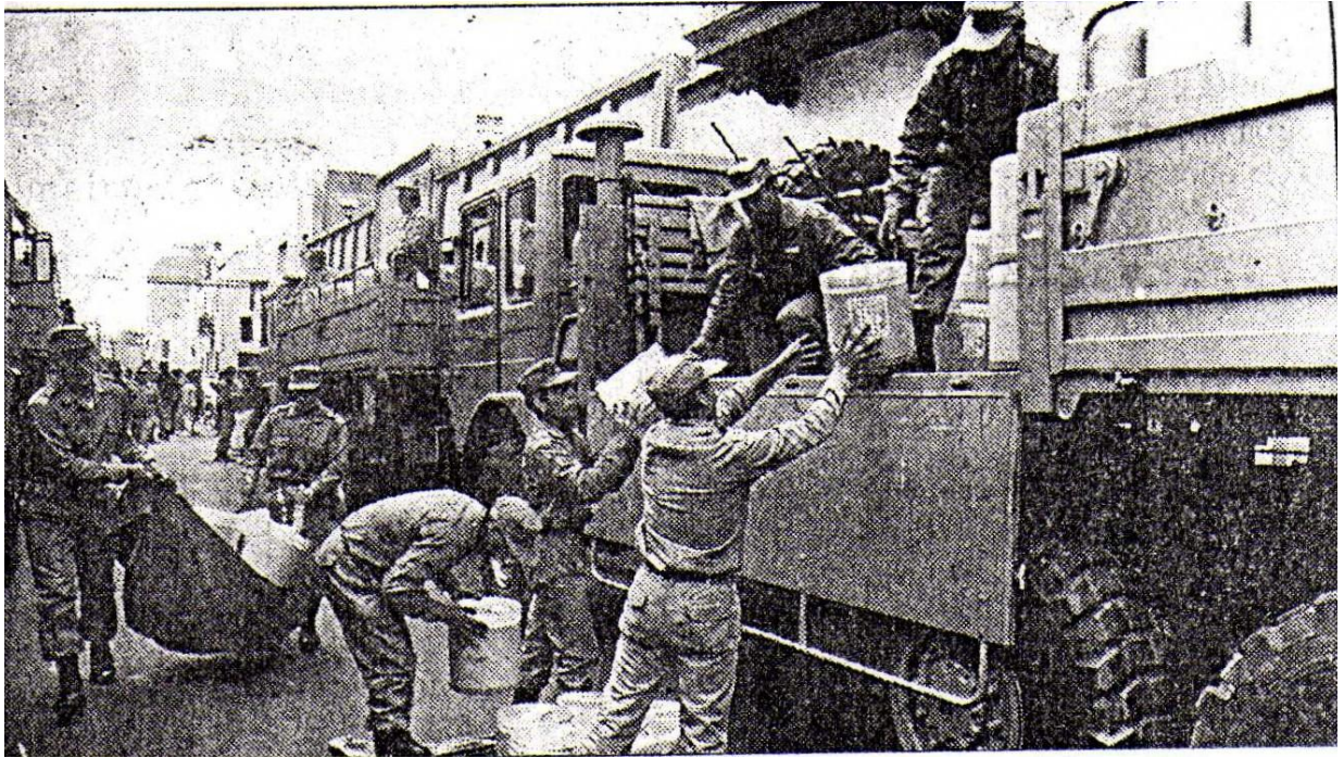
Inobjetable es el triunfo del Sí. 3 de noviembre 1993